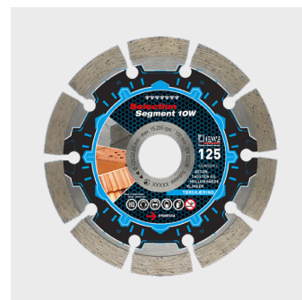
160162 - Diamantklings Segment 10W - Ø 125 mm