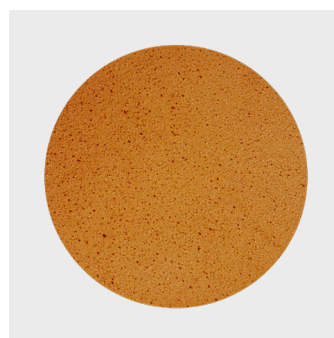
Vandskuringssvamp med velcro