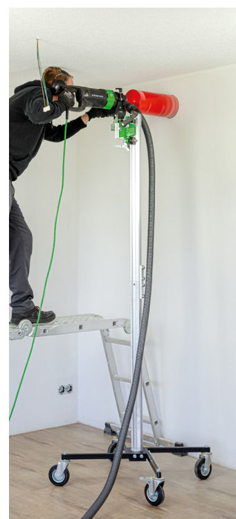
Monteret i borearm EBW 1300