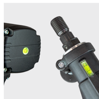
Med integreret libelle