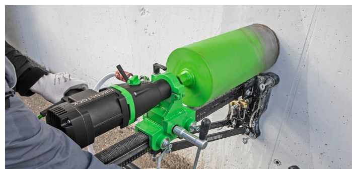
Monteret i borestander BST 182 V/S