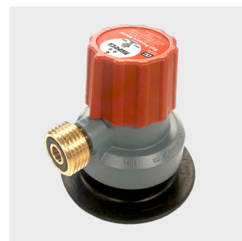
150215 - Regulator - Til click-on