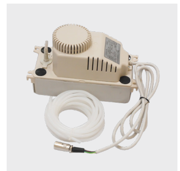
150257 - Vandpumpe