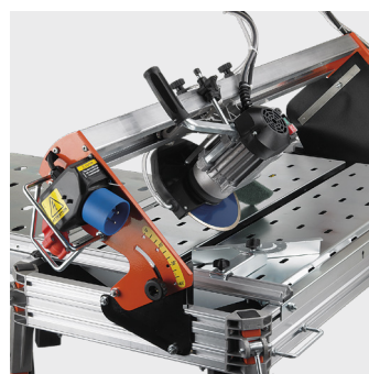
Mulighed for 45° skæring