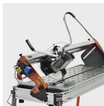
Mulighed for 45° skæring