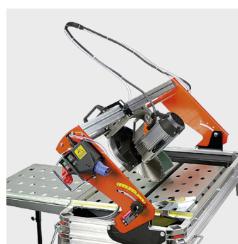
Mulighed for 45° skæring