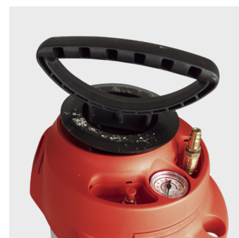
Ventil for tryklufes påfyldning kan tilkøbes