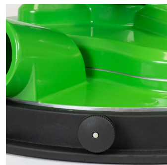
Indstilling af fræsehøjde op til 5,0 mm