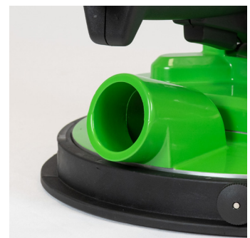
Udtag til støvsuger