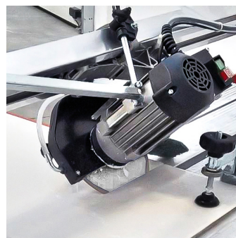
Mulighed for 45° skæring