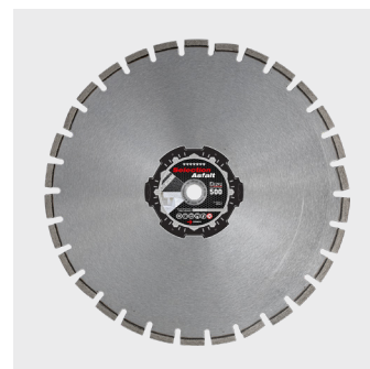
160674 - Diamantklinge - Asfalt - Ø 500 mm