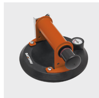
163385 - Sugeskop - Manometer